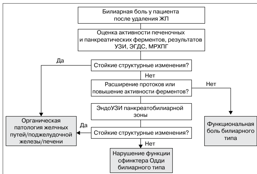
Рис. 2. Алгоритм обследования пациентов с билиарной болью Fig. 2. Diagnostic algorithm for biliary pain

го ее необходимо дифференцировать как от боли, обусловленной органической патологией (в особенности холедохолитиазом и протоковыми стриктурами), так и от функциональной билиарной боли без спазма, в основе которой лежит гипералгезия ДПК и желчных путей (рис. 2).