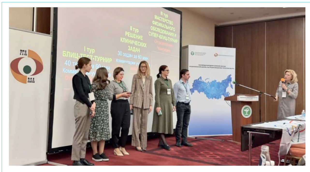
Рис. 2. Победители I тура Первой Российской олимпиады по гастроэнтерологии

Омского государственного медицинского университета, г. Омск.